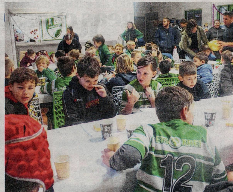
Les jeunes de l'EDR attendent chocolat chaud et part de cake. J. P. D.

Sur l'allée longeant le terrain de leurs exploits, ils se hâtent jusqu'au clubhouse. Là, en attendant, attablés, chocolat chaud et part de cake, ils ponctuent bientôt d'un « ouaaaaais » à l'unisson les explosions accidentelles des ballons gonflables distribués. La pluie continue obligeant à supprimer les nombreux jeux prévus sur le terrain, ils s'occupent entre eux sous le préau, leur imagination ludique et leur empathie naturelle apportant un bienvenu plan B. Certains préfèrent prendre d'assaut l'atelier maquillage de Mégane. Quelques mamans font des crêpes. Les papas échangent, un café à la main, un œil sur leurs rejetons. C'est après le tirage de la tombola qu'apparaît le Père Noël. Rapidement entouré, il distribue sucreries à chacun avant la traditionnelle photo. La pluie ayant enfin cessé, un petit match s'organise. Les plaquages dans la « hagne » ravissent et ajoutent un bonheur spontané à un moment inhabituel.